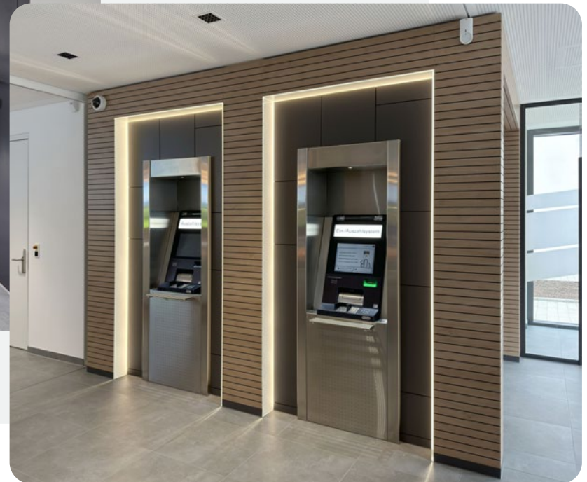
Unterschiedliche Geldautomaten im SB-Bereich.