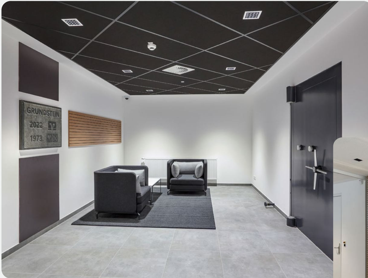
Grundstein & Wartebereich Kundenschießfachanlage.