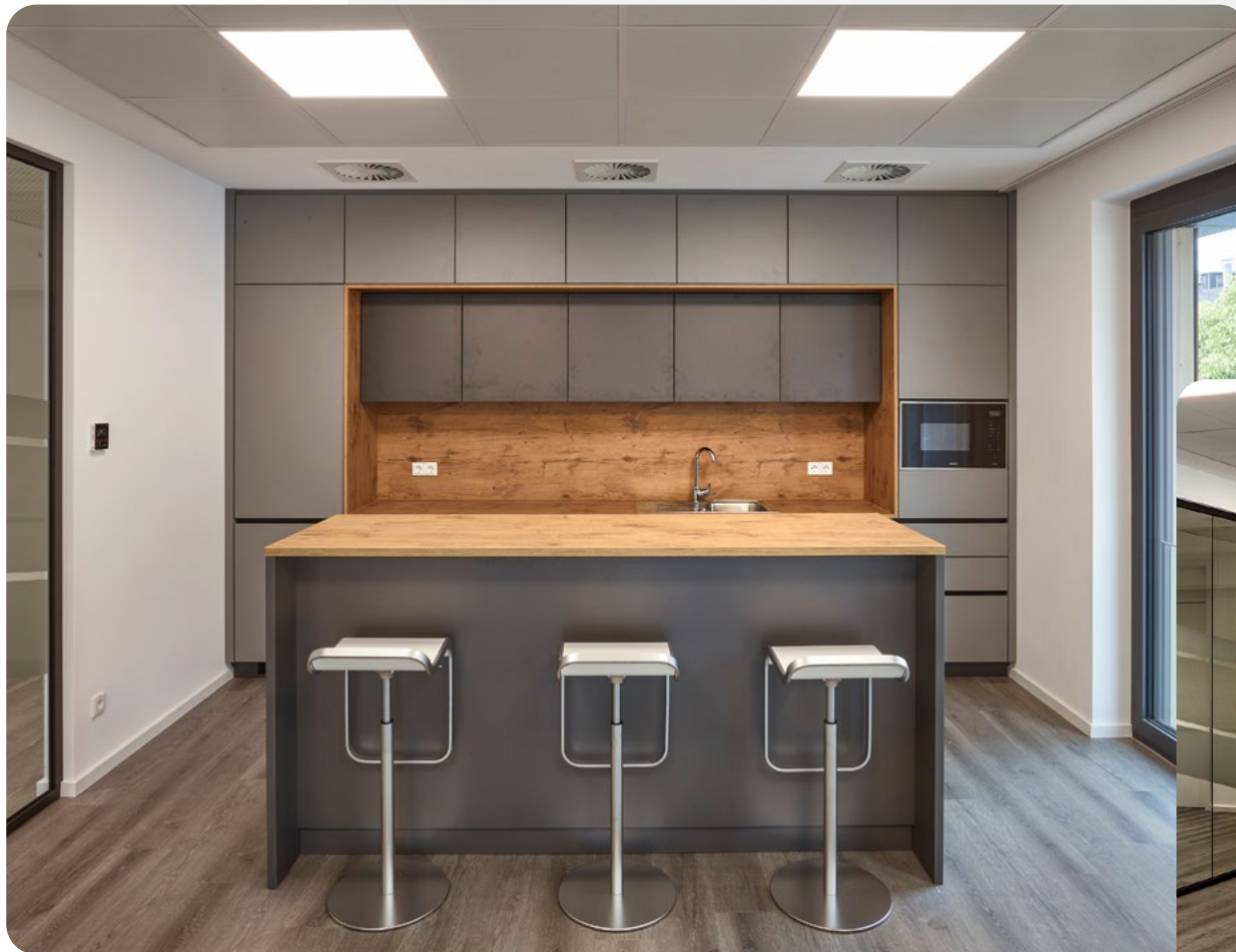
Der Sozialbereich mit Aufenthaltsqualität für die Belegschaft.