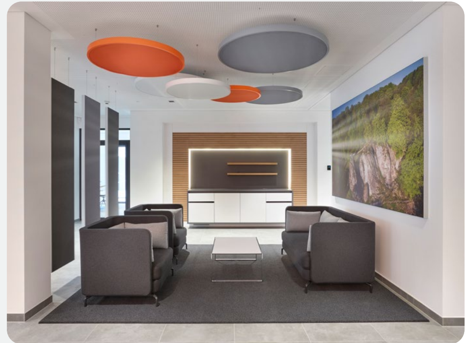
Wartebereich mit Kaffeebar.