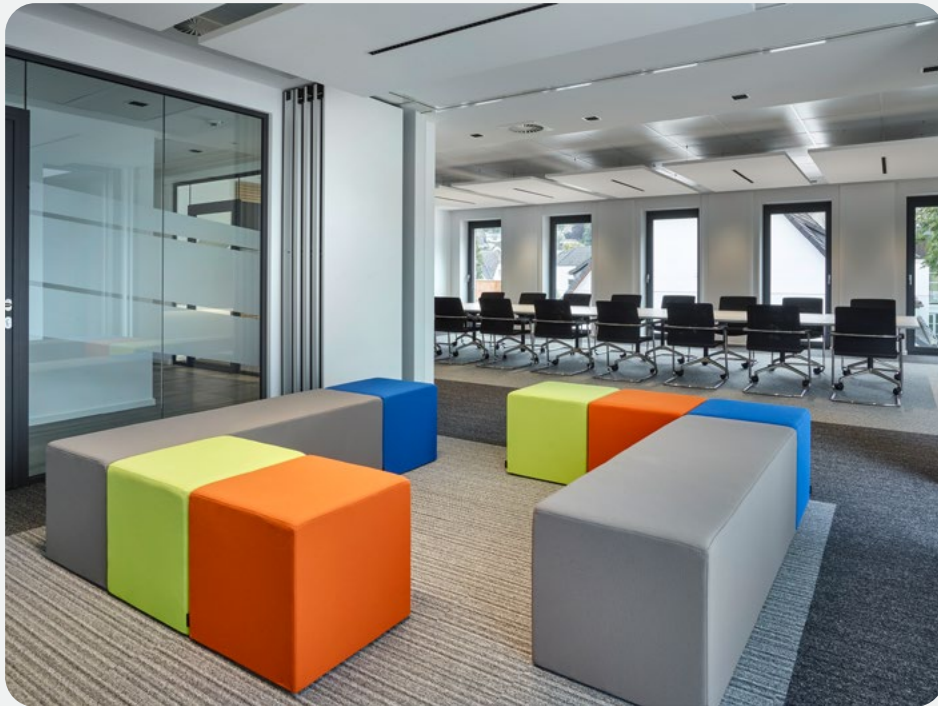
Tagungs-/Veranstaltungsraum „Piusberg“ mit abtrennbarem Rückzugsraum „Chillzone“.