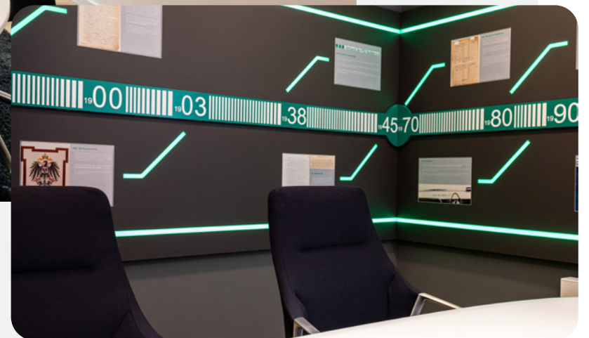
Der Beratungsraum „Zeitreise“ bietet Kunden einen einzigartigen Blick in die Geschichte der PSD Bank Rhein-Ruhr.