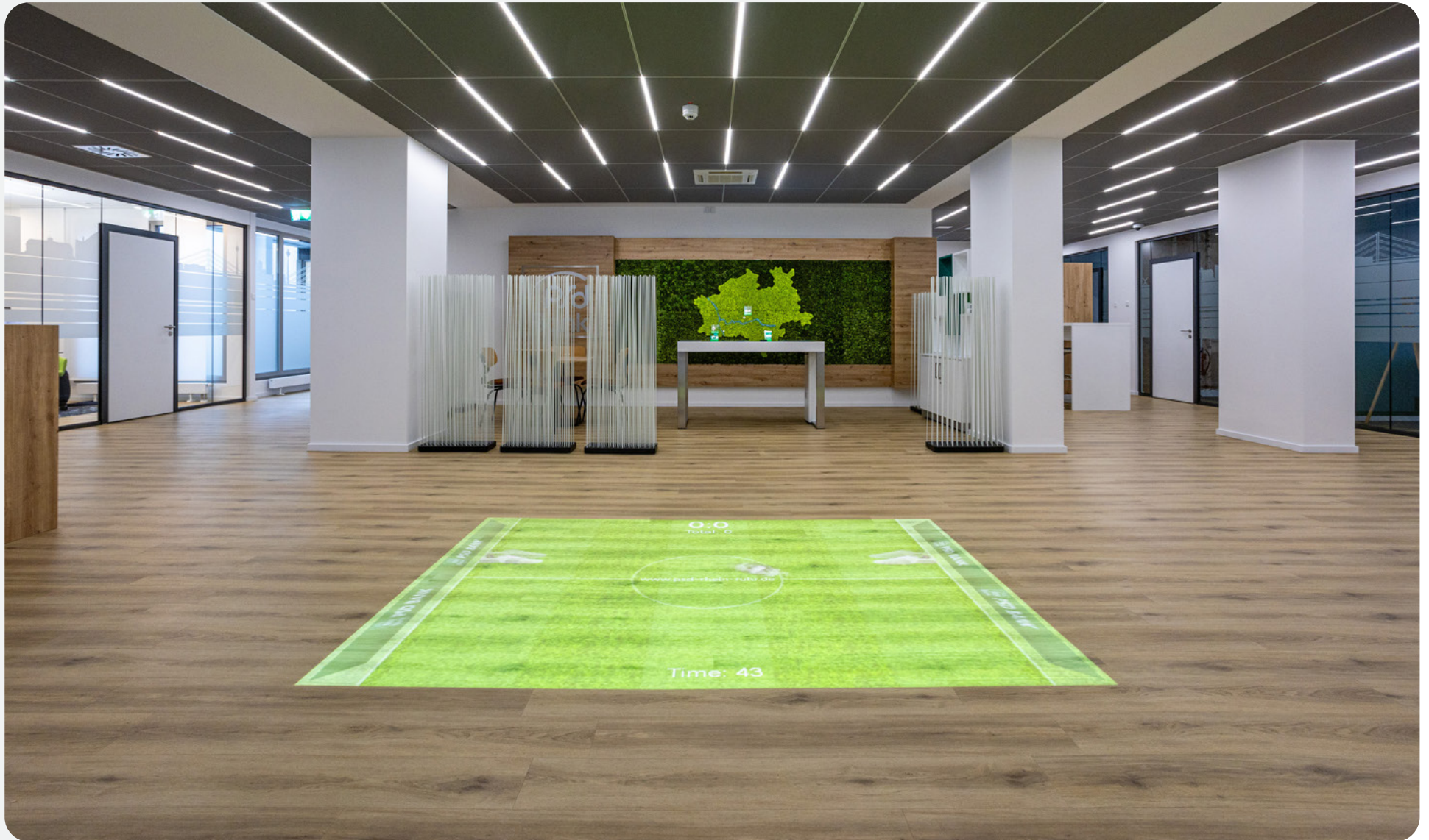
Die interaktive Bodenprojektion dient sowohl als Werbepattform als auch als Kinderspielgelegenheit