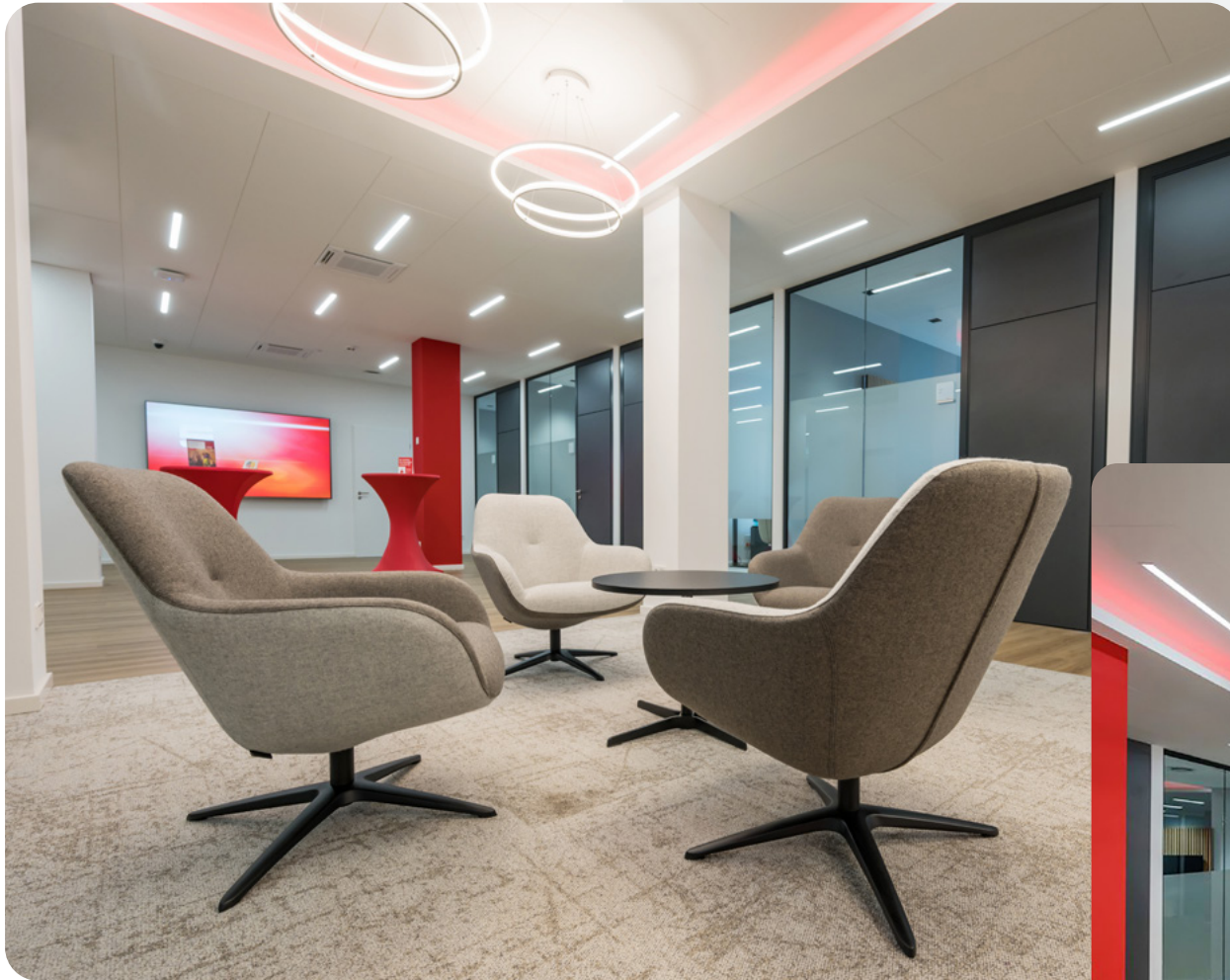
Der gemütliche Warte- und Loungebereich sorgt für einen entspannten Aufenthalt

Die Wartelounge lässt die Frankfurter Sparkasse in neuem Glanz erscheinen. Die Farben und Dekore sind in Erdtönen gehalten, hier trifft „modern“ auf „zeitlos“ und schafft eine unbeschwertere Wohlfühlumgebung.