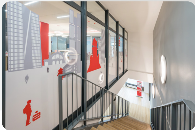
Die Treppe führt in den Beratungsbereich im 1.OG.