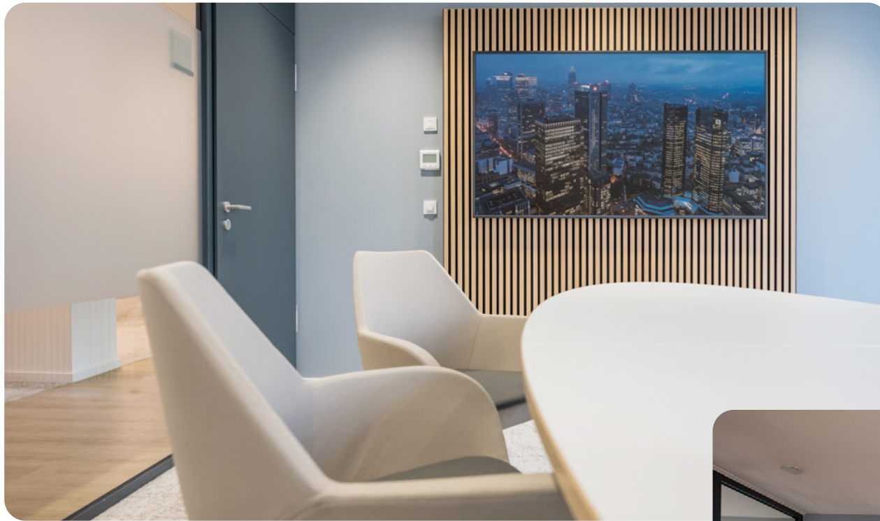
Das Design der Beratungsräume ist modern und minimalistisch.