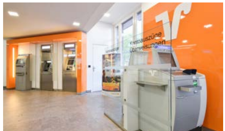
Medientisch (oben) und Konto-/Bargeldservice im SB-Bereich