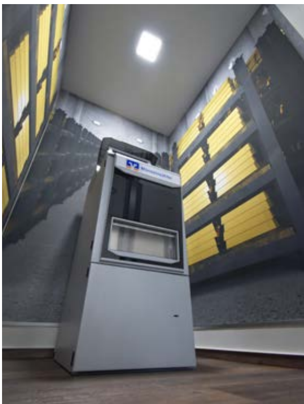
Münzeinzahler mit origineller Raumgestaltung