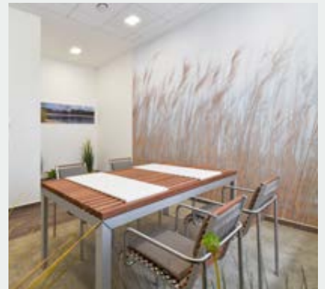
Das „Heideseezimmer“. Konzipiert nach den regionalen Besonderheiten in der Umgebung von Holdorf.