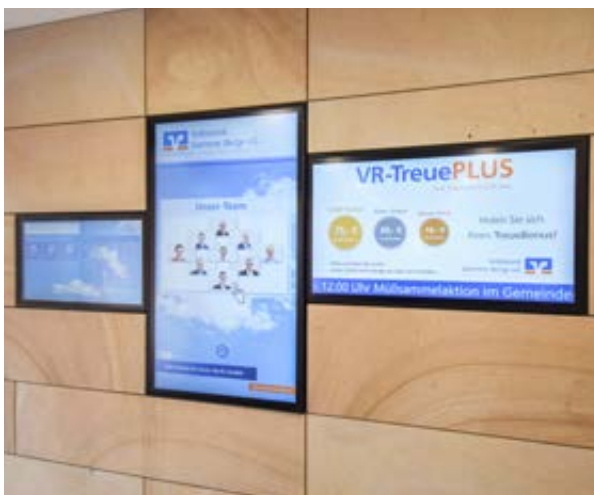
Info-Touchscreens direkt im Eingangsbereich