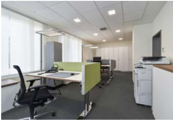
Teambüros mit elektrisch höhenverstellbaren Tischen