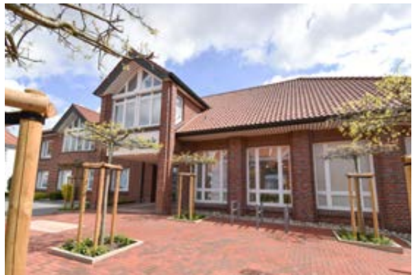
Außenansicht der Filiale