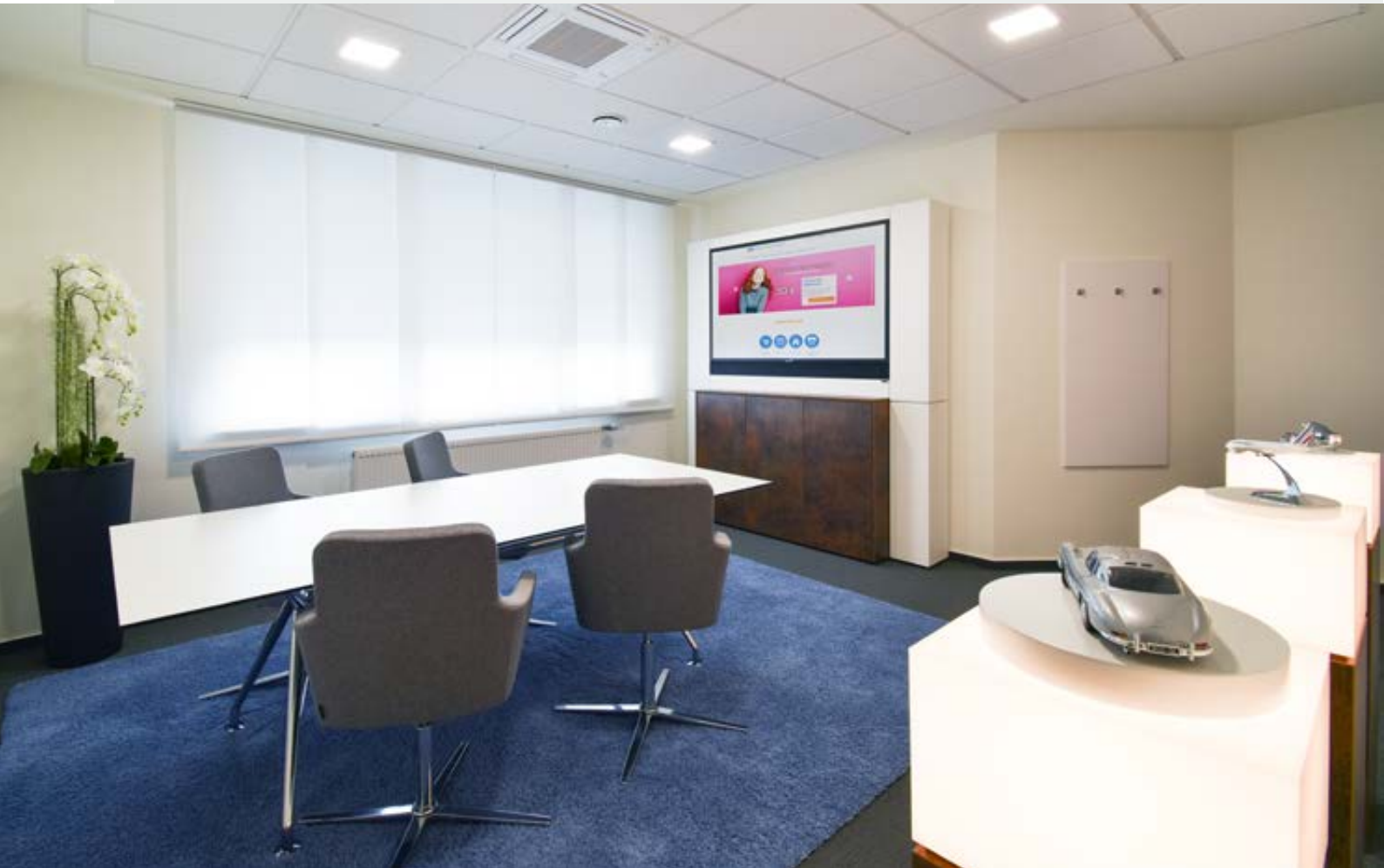
Hochwertige und stilvolle Beratungsatmosphäre – für Kunden und Mitarbeiter

Wert auf Regionalität und viel Abwechslung gelegt. Landes- und ortstypische Motive galten als Vorlage für sogenannte „Themenzimmer“. Dadurch entstand für jeden Raum ein eigenes Ambiente und Raumgefühl. Ob Strandkulisse – als adaptiertes Motiv des Heidesees in der Nähe von Holdorf – inklusive der entsprechenden Strandmöbel oder das Heimatzimmer mit Bildmotiven der Umgebung. Jedes Themenzimmer