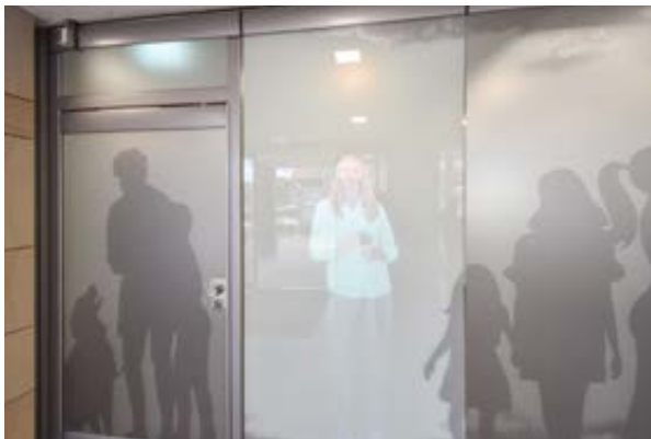
Außerhalb der Geschäftszeiten ist die Filiale „virtuell“ besetzt.