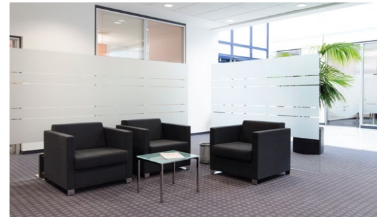
Abgetrennt durch Glasstellwände wurde ein ruhiger Wartebereich eingerichtet.

Funktionalität, eingebettet in ein beeindruckendes Raumerlebnis - für Kunden, Mitarbeiter – und gute Geschäfte.