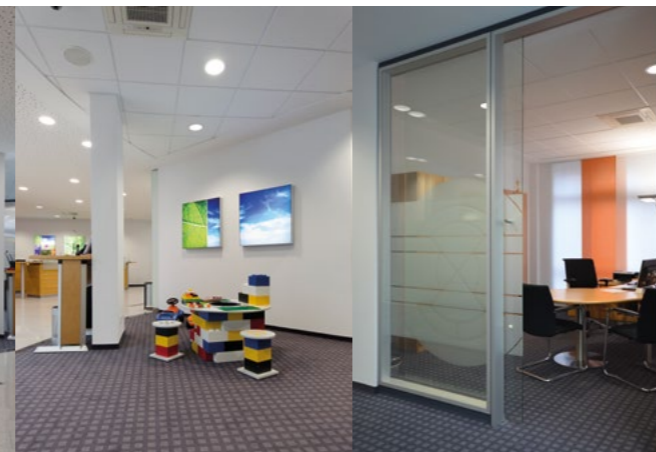
Wandakzentuierungen mit LED-Leuchtdisplays