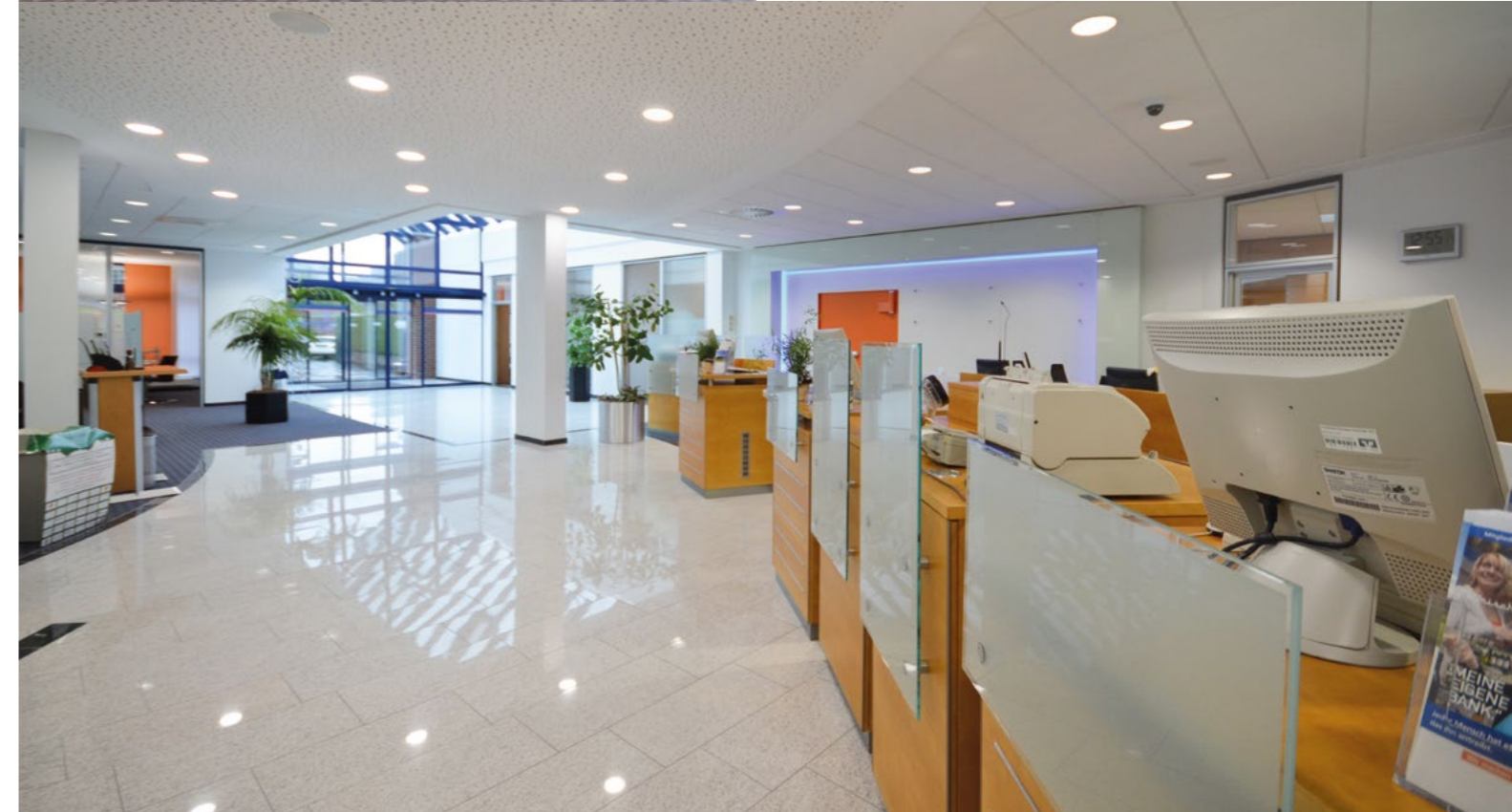
Die gestalteten Glaselemente im Thekenbereich sichern die Diskretion im Service.