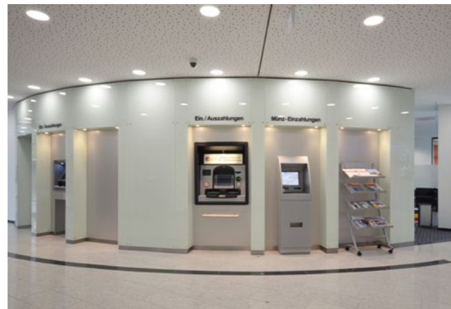
Ein großzügiger Eingangsbereich mit integrierter SB-Zone, RC 3 Sicherheitswand und einer frontseitigen Glasgestaltung - inklusive Boden-Intarsie für die optische Markierung des Diskretionsabstandes.