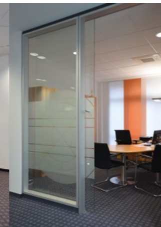
Die Beratungszimmer wurden mit großzügigen und transparenten Zuwegungen gestaltet.

Durch die offene Raumgestaltung haben Mitarbeiter im Service-Bereich ihre Kunden stets im Blick.